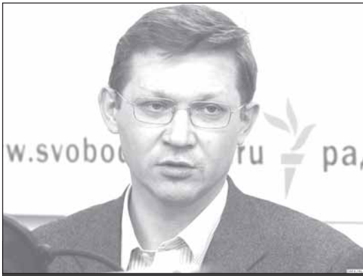
Владимир РЫЖКОВ, российский политик и политолог, депутат Государственной думы I–IV созывов.

ДОВОЛЬНЫ ВЛАСТЬЮ В РОССИИ ДВЕ КАТЕГОРИИ ЛЮДЕЙ: ТЕ, КТО НЕ В КУРСЕ, И ТЕ, КТО В ДОЛЕ