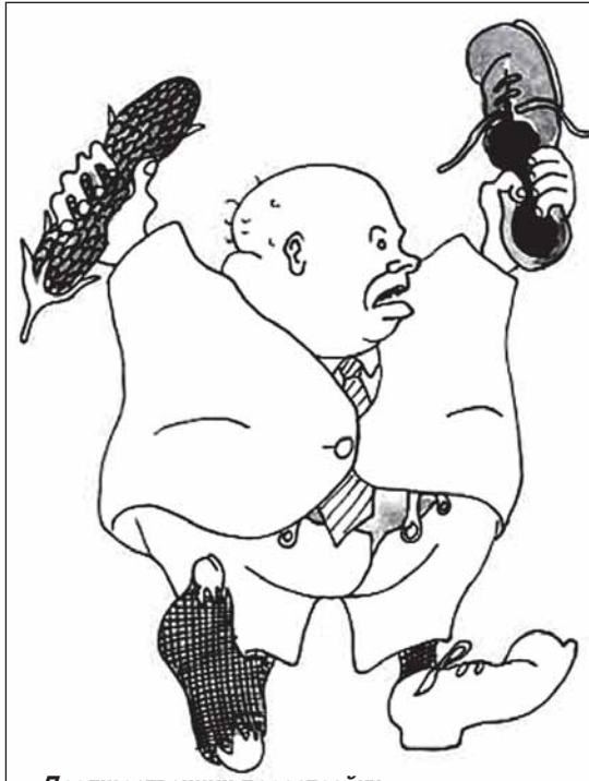
Предшественник перестройки. Рис. Александра ЗИНОВЬЕВА.

Всё «несчастье» учёного заключалось в том, что в США его труд был опубликован в годы «перестройки», когда под прикрытием «гласности» в СССР массовыми тиражами выходила литература одних только его оппонентов. Отку-