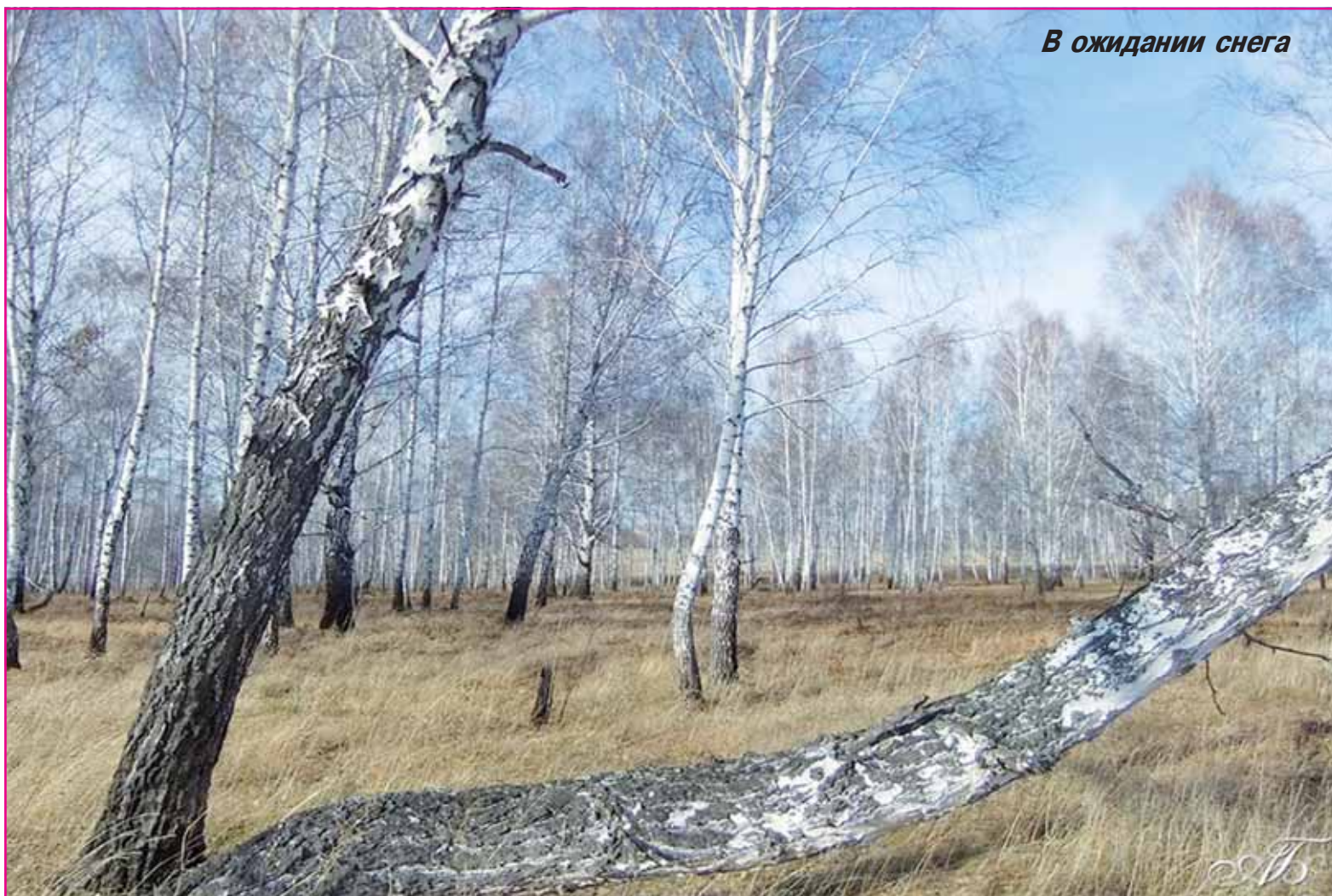
В ожидании снега