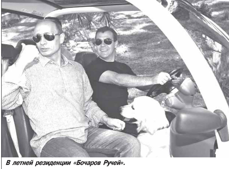
В летней резиденции «Бочаров Ручей».

процедур получения разрешений на строительство мы оказались на предпоследнем месте, обойдя лишь нищую, диктаторскую, находящуюся под санкциями ООН Эритрею.