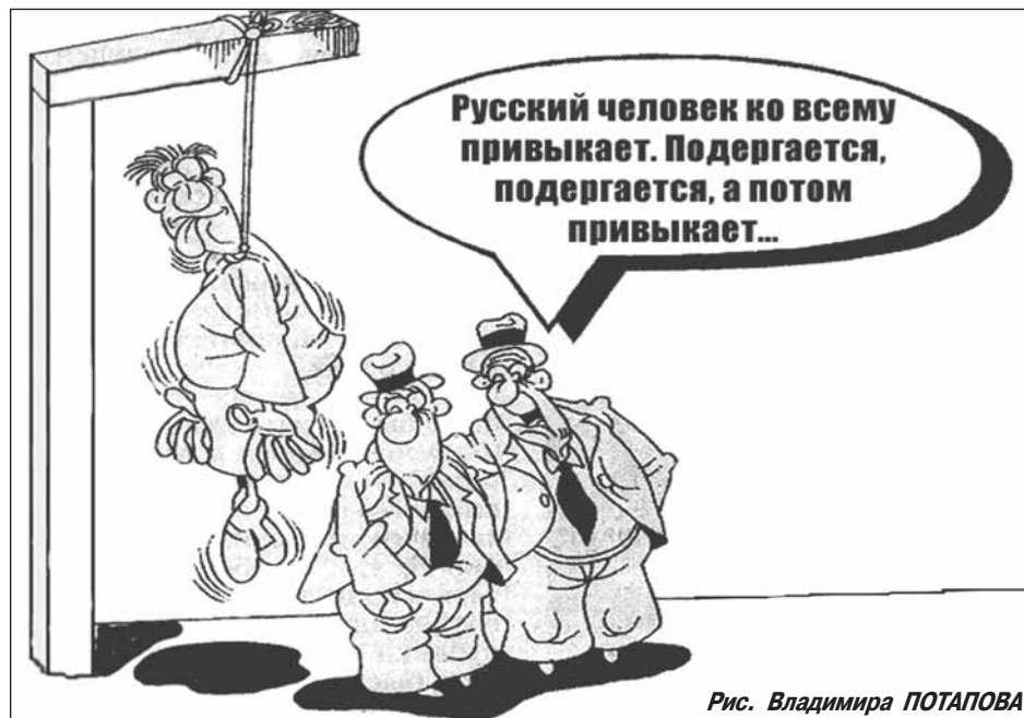
Рис. Владимира ПОТАПОВА

Заказной и ложный донос на редакцию нашей газеты направили в Генпрокуратуру депутаты Щёлковского горсовета и примкнувший к ним Вельможин