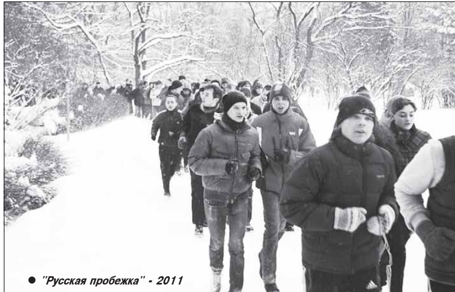
● «Русская пробежка» - 2011

Господ полицейских, в какой-то степени можно понять: праздник, усиление, да к тому же еще слишком мало времени прошло после трагедии в «Домодедово» – надо показывать усердие (его бы, впрочем, надо показывать в другом месте, но я, наверное, слишком многого хочу). Но даже несмотря на это ситуация абсурдна до предела. Особенно если учесть то, какие обвинения были предъявлены «нарушителям» в ОВД «Измайлово». Опять-таки цитирую TIME-4.info: «В ОВД всем задержанным были оформлены стандартные административные правонарушения – «нецензурную брань в общественном месте» и штраф 500 руб.». Я так