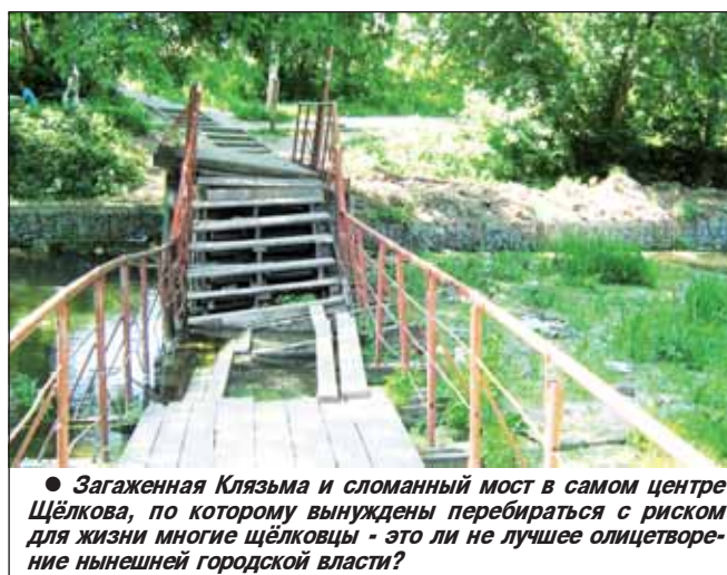
● Загаженная Клязьма и сломанный мост в самом центре Щёлкова, по которому вынуждены перебираться с риском для жизни многие щёлковцы - это ли не лучшее олицетворение нынешней городской власти?