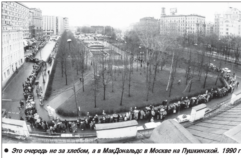
● Это очередь не за хлебом, а в МакДональдс в Москве на Пушкинской. 1990 г.

ХОРОШИЙ СЛОГАН! Вчера, 9 мая 2011 года придумал. Он как-то сам появился в голове и начал сверлить мозг. Я был вчера в музее Великой Отечественной Войны, смотрел фотографии Евгения Халдея. Большая экспозиция. Потом экспозицию музея. И давили слёзы. От гордости, от силы, мужества и самопожертвования тех людей. И от жалости, понимания того, что эти люди преданы нами спустя каких-то сорок пять лет после окончания войны, ещё при жизни многих из них. Они умирали, не задумываясь, ради того, чтобы мы могли свободно, не боясь жить и учиться, воспитывать детей и внуков, просто жить, творить, радоваться. Ради этого они сначала спасли, а потом в короткий срок восстановили свою Родину. Как когда-то сказала моя мама: «Мы видели, что мы живём лучше наших родителей, а вы (дети) живёте лучше нас, и мы верили, что наши внуки и правнуки будут жить ещё лучше. Ради этого мы жили и работали».